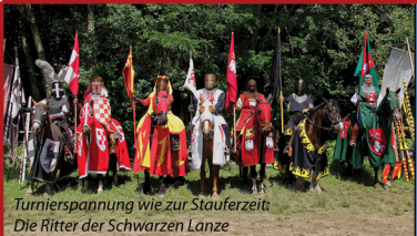
Turnierspannung wie zur Stauferzeit Die Ritter der Schwarzen Lanze