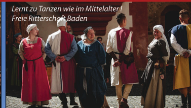
Lernt zu Tanzen wie im Mittelalter! Freie Ritterschule Baden