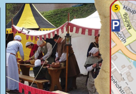
Historisches Lagerleben auf den Jagstwiesen