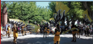
Fliegende Fahnen aus Möckmühls Partnerstadt Die Fahnenchwinger von Cherasco

Außerdem: Hexenturm Sa. 14-17 Uhr geöffnet Märchen am Spinnrad in den Marktgassen