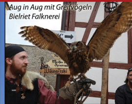
Aug in Aug mit Greifvögeln Bielriet Falknerei