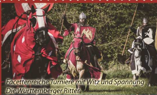
Facettenreiche Turniere mit Witz und Spannung Die Württemberger Ritter