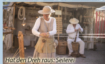
Hat den Dreh raus: Seilerei