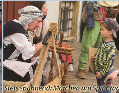
Stets spannend: Märchen am Spinnrad