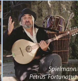
Spielmann Petrus Fortunatus