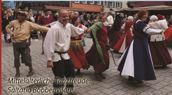
Mittelalterliche Tanzfreude: Saltatio Bobbenwilare