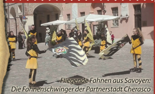
Fliegende Fahnen aus Savoyen: Die Fahنشwinger der Partnerstadt Cherasco