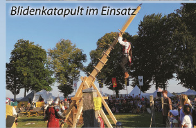
Blidenkatapult im Einsatz