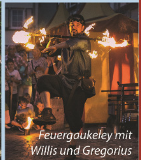
Feurgaukeley mit Willis und Gregorius